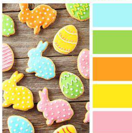
Цветовая палитра светлых нежных цветов