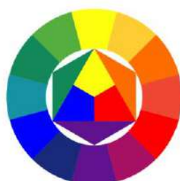
Цвета как ноты – базовых цветов три, а сочетаний бесконечно много.

Знать психологию цвета мало, так же важно уметь сочетать цвета между собой. Цвета как ноты – базовых цветов три, а сочетаний бесконечно много. Цветовой круг поможет в выборе сочетающихся между собой цветов.